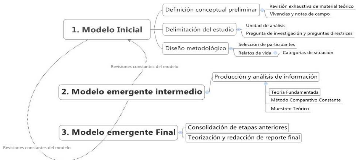
Figura 2. Fases de la construcción de un modelo comprensivo de análisis

Por otro lado, es pertinente retomar en este apartado lo referido al punto de saturación y relatos de vida provisionalmente terminados. Esto, pues si bien se ha llegado a la construcción final de un modelo emergente, no podemos obviar su carácter dinámico en tanto se aleja de la configuración de un modelo estrictamente acabado (Figura 2). Se instala más bien, como una plataforma que invita a trabajos futuros a repensar de manera constante la representación de la situación de inmigración.