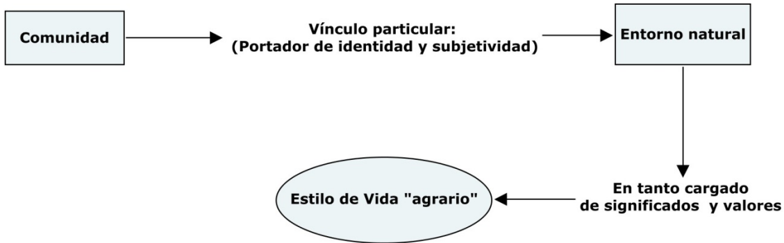
Figura 2. Vínculo con el entorno y estilo de vida agrario.

los estudios de Pegg (citado en Urkidi, 2008), donde se señala que las zonas mineras tienen comparativamente mayores niveles de prostitución, alcoholismo, enfermedades como el SIDA e inequidad social.